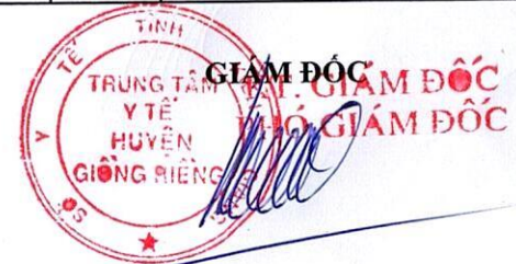
Hà Quốc Việt