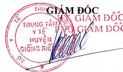
Hà Quốc Việt