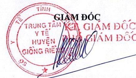
Hà Quốc Việt