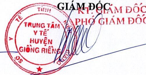
Hà Quốc Việt